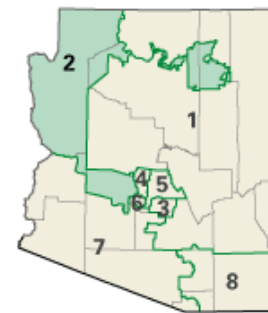
Arizona (8 Districts)